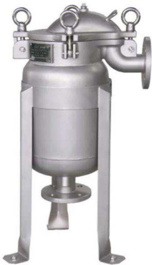
obudowa z płaszczem grzejnym