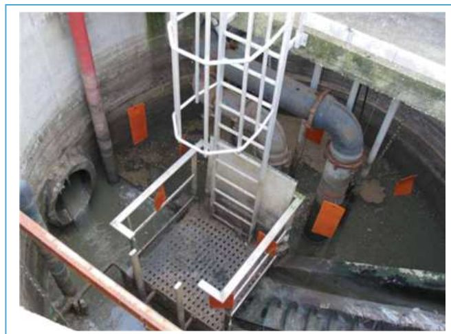
maty Gelactiv® SHK w przepompowni ścieków

Czas technologicznego zużycia się mat w sieci kanalizacyjnej, to 6 -10 miesięcy