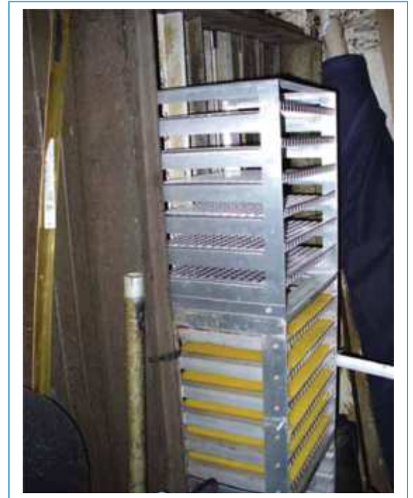
sekcja z panelami w centrali wentylacji