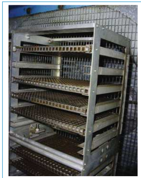
sekcja z panelami przy wyciągu