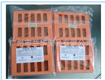
kasety z matami GELACTIV® AFG