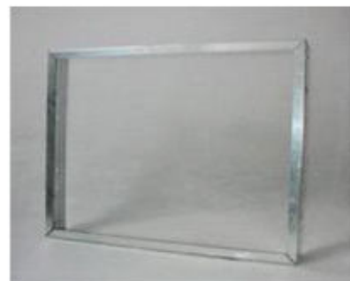
Tabela standardowych rozmiarów:

Opis: Ramy montażowe przeznaczone są do łatwego montażu filtrów kieszeniowych, kompaktowych i kasetowych w kanałach układów wentylacyjno – klimatyzacyjnych. Ramy wykonane mogą być z blachy stalowej, ocynkowanej lub nierdzewnej. Powierzchnia styku ramy z filtrem uszczelniona jest uszczelką polipropylenową. Filtr dociskany jest do ramy montażowej czterema elementami sprężystymi co zapewnia doskonałą szczelność.